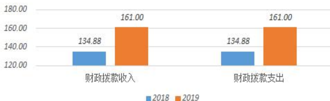
2019年度财政拨款收支与2018年度决算对比情况 (单位：万元)

政拨款，其中本年收入 161 万元，比 2018 年度增加 26.12 万元，增长 19.36%，主要是 2019 年度人员工资标准及日常公用经费标准调整；本年支出 161 万元，增加 26.12 万元，增长 19.36%，主要是 2019 年度人员工资标准及日常公用经费标准调整。