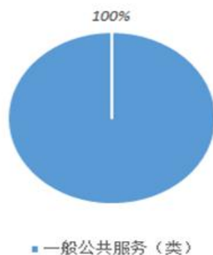
财政拨款支出决算结构情况

2019 年度财政拨款支出 161 万元，主要用于以下方面：一般公共服务（类）支出 161 万元，占 100%；公共安全类（类）支出 0 万元，占 0.00%；教育（类）支出 0 万元，占 0.00%；科学技术（类）支出 0 万元，占 0.00%；社会保障和就业（类）支出 0 万元，占 0.00%；住房保障（类）支出 0 万元，占 0.00%。